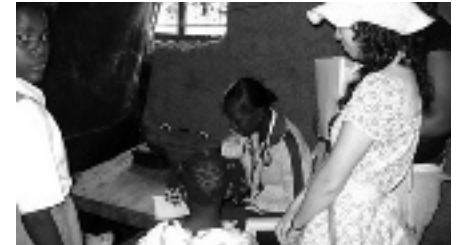
Bij de dokter