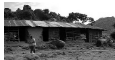
De oude Wandega School