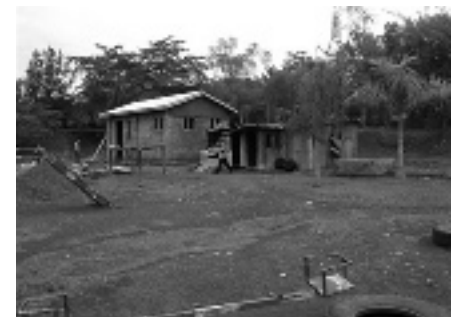
De nieuwe keuken (l), het 'rookhol' (r)