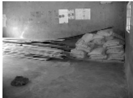
De bouwmaterialen, hout en cement