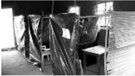
De zelfgemaakte behandelkamer