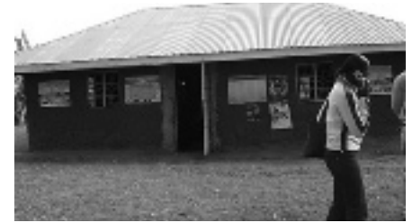
De Hira Ben School