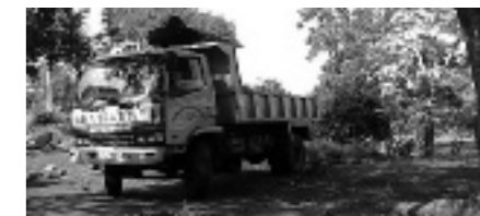
Een vrachtwagen vol met bomen

geeft ze de moed niet op: ze is een nieuw project gestart nl. duizenden kinderen planten hun eigen boom. De bedoeling is uiteraard dat zij dan ook hun eigen boom verzorgen en er dan, meestal na een jaar, letterlijk de vruchten van kunnen plukken.