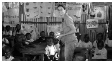
Ren in actie op school