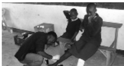
Wondverzorging op school