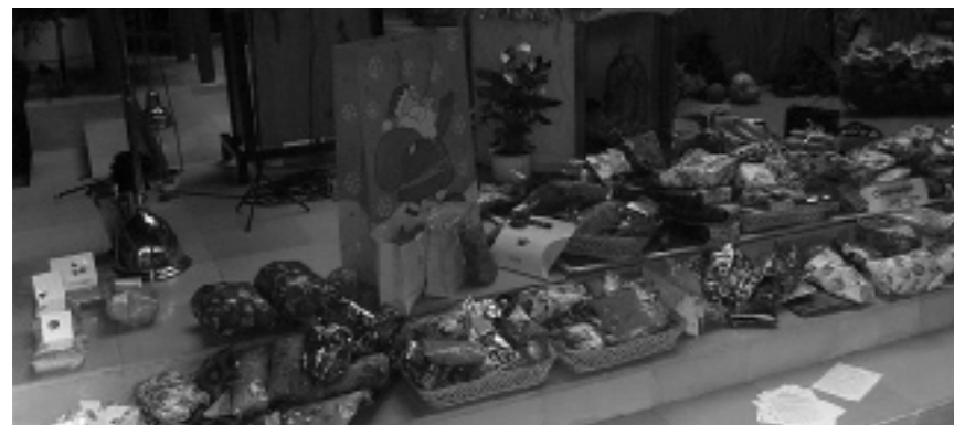
Kerstkadootjes voor Kisumu in de Parochiekerk te Cuijk Noord