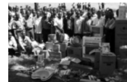
Alle leerkrachten van de Masenoschool bij de zojuist gekregen schoolmaterialen