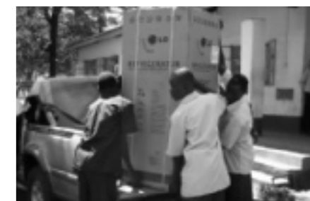
...en een nieuwe koelkast wordt uitgeladen