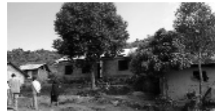
Een nieuw lokaaltje

We hebben ons ontfermd over een 'nieuwe'school: Ngop Ngoso. Deze ligt op de weg naar Bondo en is gedeeltelijk klaar. Er zijn nog geen ramen/deuren en de muren en de vloer moeten afgewerkt worden. We zullen wat foto's sturen en wellicht kan de Klara Foundation deze job afmaken!