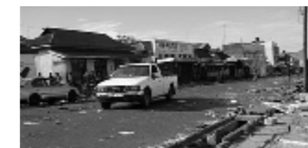
Centrum van Kisumu in puin

In 2008 ontvingen we diverse berichten van onze contactpersonen en goede vrienden: De Pabari's. Hierbij wat citaten: