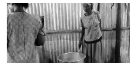
Voedselprogramma gaat door