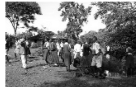
Leerlingen Sinyoloschool planten ieder hun eigen boom.