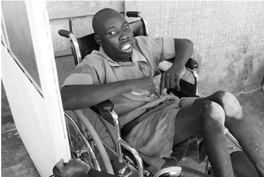
Zo blij met z'n eigen rolstoel... niet meer kruipen op handen en knieën