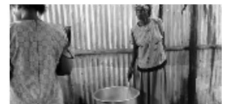
Voedselprogramma gaat door