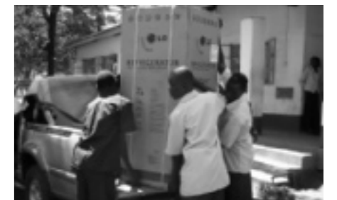
...en een nieuwe koelkast wordt uitgeladen