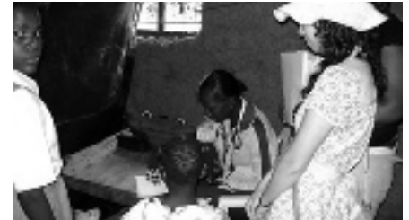
Bij de dokter