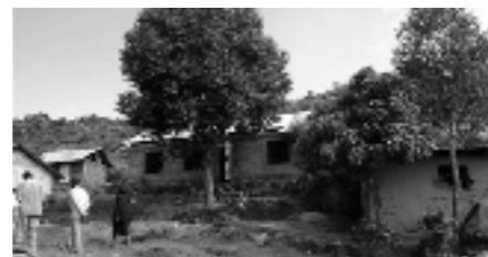
Een nieuw lokaaltje

We hebben ons ontfermd over een 'nieuwe'school: Ngop Ngoso. Deze ligt op de weg naar Bondo en is gedeeltelijk klaar. Er zijn nog geen ramen/deuren en de muren en de vloer moeten afgewerkt worden. We zullen wat foto's sturen en wellicht kan de Klara Foundation deze job afmaken!