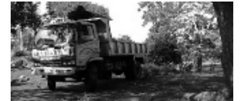
Een vrachtwagen vol met bomen

geeft ze de moed niet op: ze is een nieuw project gestart nl. duizenden kinderen planten hun eigen boom. De bedoeling is uiteraard dat zij dan ook hun eigen boom verzorgen en er dan, meestal na een jaar, letterlijk de vruchten van kunnen plukken.