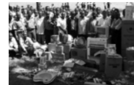
Alle leerkrachten van de Masenoschool bij de zojuist gekregen schoolmaterialen