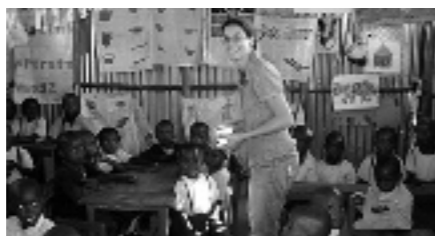
Ren in actie op school