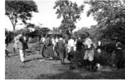
Leerlingen Sinyoloschool planten ieder hun eigen boom.